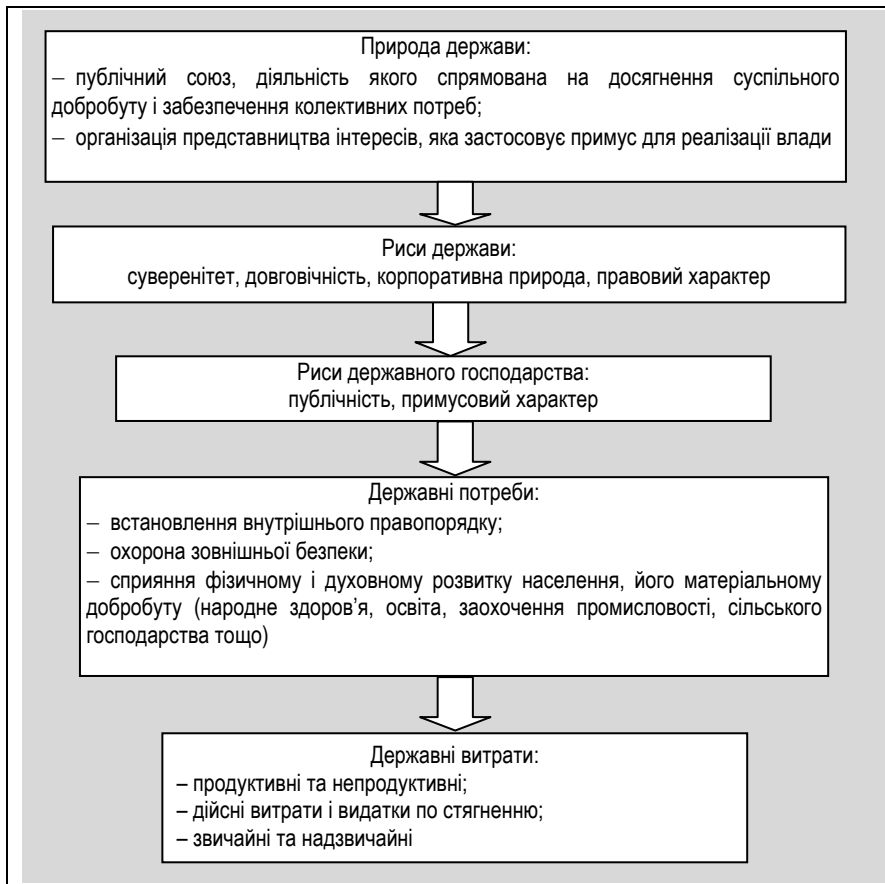
Рис. 1.2. Взаємозв'язок розвитку держави, державного господарства, державних потреб і державних витрат