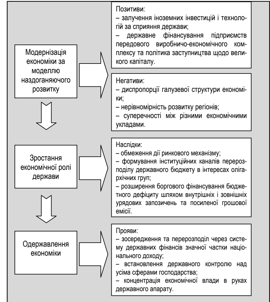
Рис. 1.3. Механізм впливу процесів етатизації на економічний розвиток на межі XIX–XX ст.

М.Туган-Барановського 28 , доповнювалися і посилювалися урядовою діяльністю (рис. 1.3).