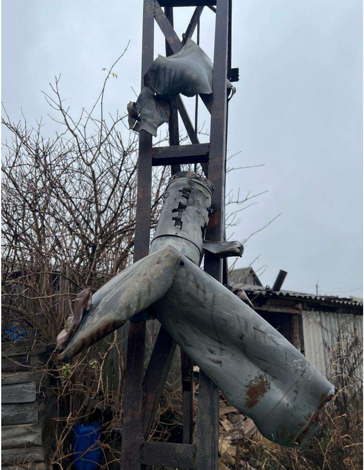
Залишки боєзарядів, зібрані фермером на полях фермерського господарства. Село Почепин, Макарівська селищна громада Бучанського району Київської області. 16.11.2022.