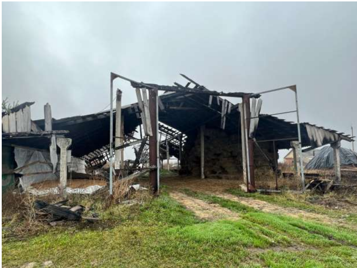
Зруйновані виробничі будівлі фермерського господарства «Світанок». Село Почепин, Макарівська селищна громада Бучанського району Київської області. 16.11.2022.

ледь не стала екологічною катастрофою – сталася у травні 2022 року на Чорнобаївській птахофабриці [найбільша птахофабрика у Європі] в Херсонській області, де загинуло понад 4 мільйони курей і близько 700 тисяч курчат без можливості їх утилізації в результаті авіаудару російської авіації по місцевій електростанції.