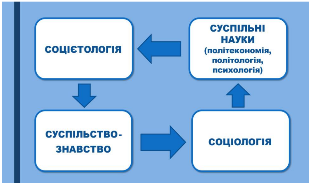
Рис. 2. Формування соціетології як науки