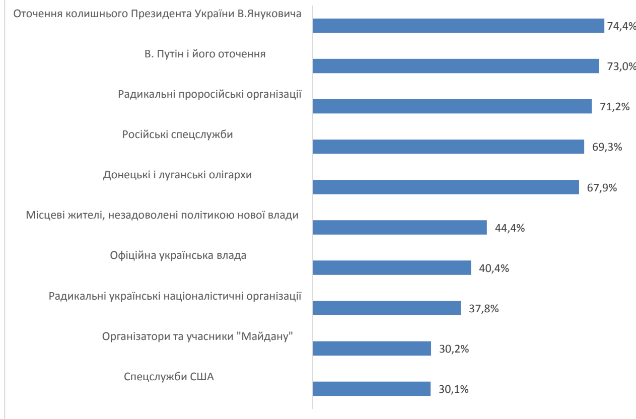
Рис. 4. Частка опитаних, згодних з тим, що такі суб'єкти продовжують сприяти силовому протистоянню і бойовим діям на Донбасі, %

У той же час, більшість жителів України згодні, що сприяють продовженню силового конфлікту В. Янукович зі своїм оточенням і В. Путін із своїм оточенням. Практично стільки ж вважають, що відповідальність несуть і радикальні проросійські організації, російські спецслужби і місцеві донбаські олігархи. Всі зазначені варіанти набрали від 67,9% до 74,4% підтримки.